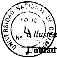
Ilustración. Dos siglos de Reformas en la enseñanza. Ministerio de Educación y Ciencia. Madrid.